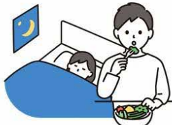
十分な休養と バランスのとれた食事