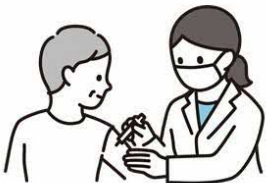
インフルエンザ ワクチンの接種