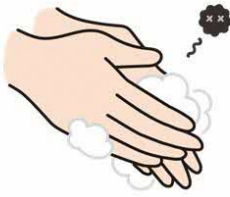
手洗い等の手指衛生